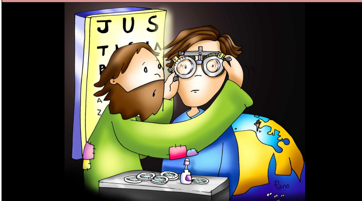
JESÚS Y EL CIEGO BARTIMEO (Mc 10, 46 - 52)