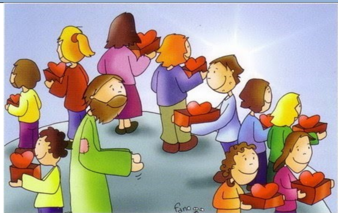
LA MISIÓN DE LOS SETENTA Y DOS (Lc 10, 1 - 9)